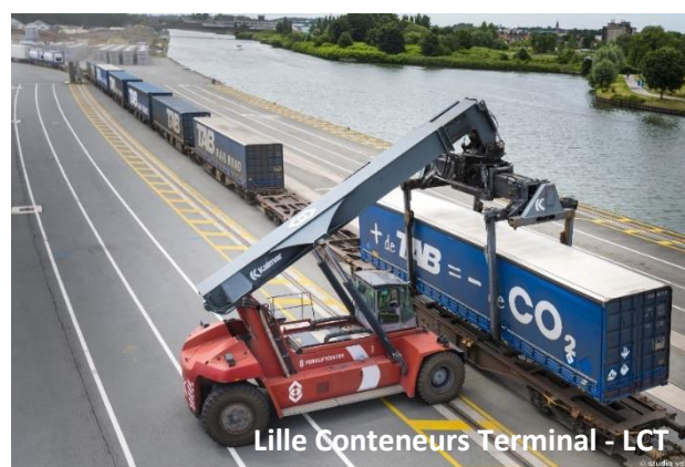
Lille Conteneurs Terminal - LCT

Gratuit et sur inscription à partir du 14 septembre à 14h sur jep.lille.fr